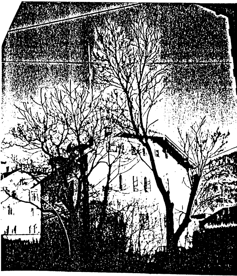
Links: In diesem Haus (im Keller) befindet sich der italie- nischsprachige Sender "Radio Maia (Méran)