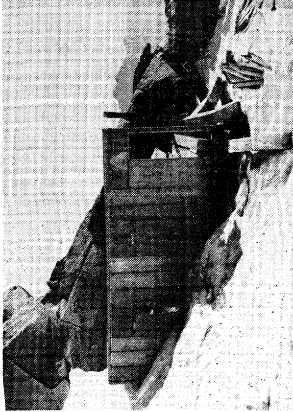
Ein vor sich hinrostender Container, der entgegen der gerichtlichen und behördlichen Aufforderung entfernt worden ist.

Man darf gespannt sein, wie es auf dem Gletscher weitergeht, der aus den Schlagzeilen nicht mehr wegzudenken ist. Daß Huber immer wieder für eine Überraschung gut ist, hat er gezeigt. Nun sollte, so meinen Insider, auch das Land einmal unter Beweis stellen, daß es für Überraschungen gut ist und daß es den Traum von den Kompetenzen im Äther handfesten Tatsachen vorzieht.