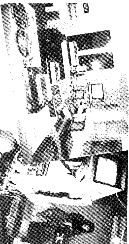
TVS Südtiroler Fernsehwellen Sender Meran Anton Gamper & Co. KG - S. A. S. Etschangersstraße 21 I - 39025 Naturns