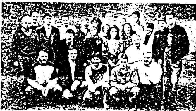
Die „Rundfunkmannschaft“ beim Jubiläumsfoto