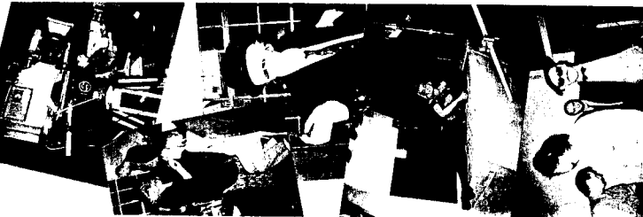
Momentaufnahmen von den Dreharbeiten zum Radio-Victoria-Werbespot für Pro 7.