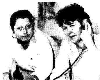
Das sind sie – unsere Redaktionsdamen,

Ein eigener Aufnahmewagen und versierte, musikerfahrene Techniker garantieren für beste Qualität dieser Sendungen mit Volksmusik und Brauchtum aus dem Ostallgäu.