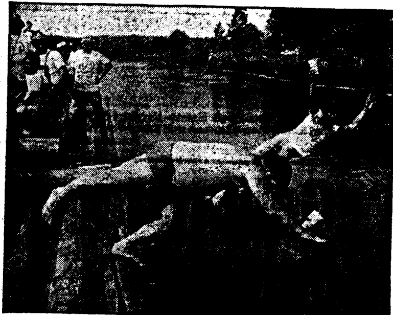
Heiß her ging's bei der tz-Floßfahrt. Da war eine Erfrischung im (sehr) kalten Naß gerade richtig.