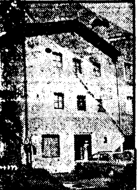
Scheinbar: „Radio-Brenner“-Station in Sterzing

sie glatt vergißt, daß sie ja im Süden, in Italien, am Mikro sitzt.