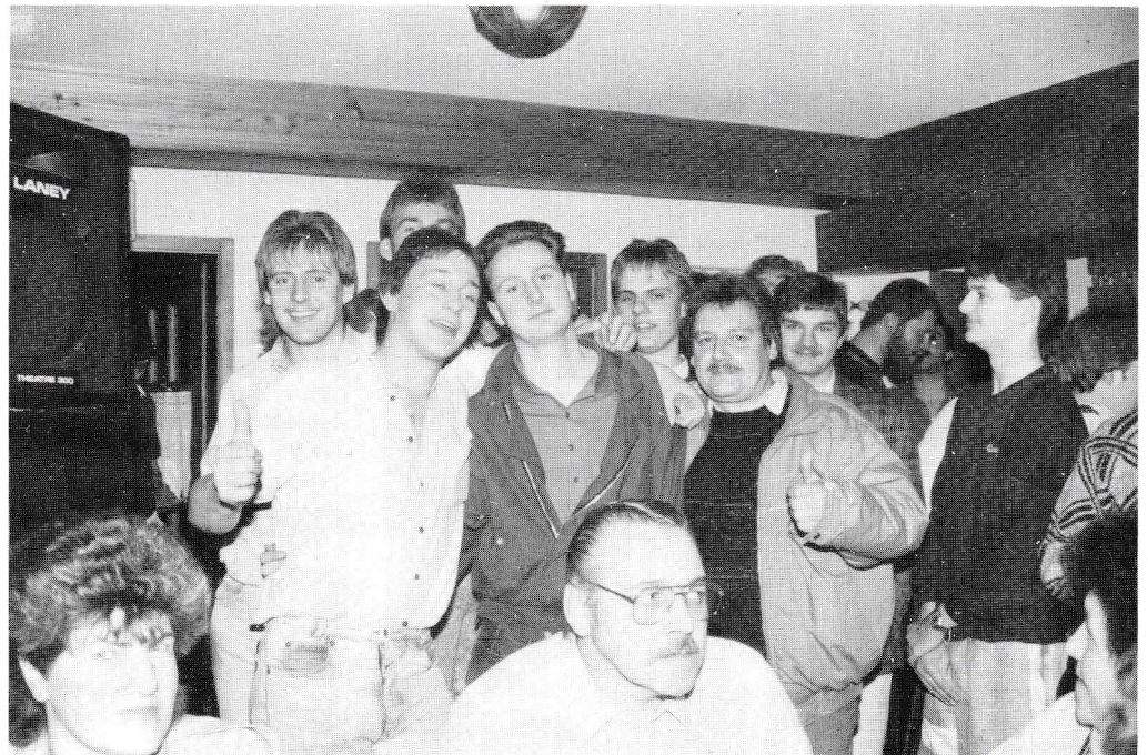
STIMMUNG UND SPASS beeindrucken regelmäßig nach Suchfahrten oder sonstigen Veranstaltungen von „HOCHRHEIN RADIO Antenne 3“. Auf direkte Kontakte zu den Hörern legen die Radiomacher aus Bad Säckingen größten Wert.

Ühlingen-Brenden. Mit ihrer neuen Langspielplatte eroberten sich die „Brendener Bergbuebe“ spontan den ersten Platz in der HRA 3-Volksmusik-Hitparade vom Juli. Ihr Titel „Töff-Töff-Polka“ erhielt mit Abstand die meisten Stimmen. Solch ein „Gipfelsturm“ spricht für die musikalische Qualität und das Können der beliebten Formation, die weit über die Grenzen der näheren Heimat hinaus bekannt ist.