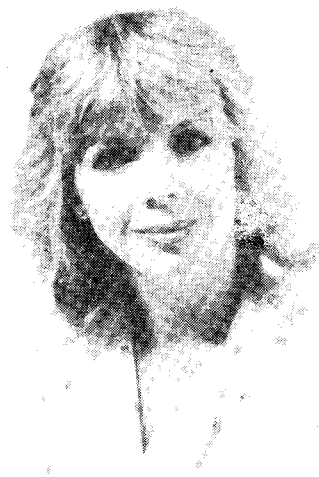
DAS RADIOGIRL DES MONATS

Nach dem durchschlagenden Erfolg der Nummer 1 der Rundschau, erscheint nun eine umfangreiche, regelmäßig erscheinende Illustrierte auf dem Markt. Sie verbindet in lockerer Form die Interessen der Radiohörer, der Inserenten und der Leser, denn unsere Kundschaft hat den Zug der Zeit erkannt und kombiniert ihre Werbung mit entsprechenden PR-Sendungen bei TELERADIOVINSCHGAU. Die optimalste Art der Verbraucherinformation ist so zu 100 % gewährleistet. Die RADIORUNDSCHAU ist und bleibt ein Forum im Interesse der Allgemeinheit und wünscht den Lesern eine gute und informative Unterhaltung.