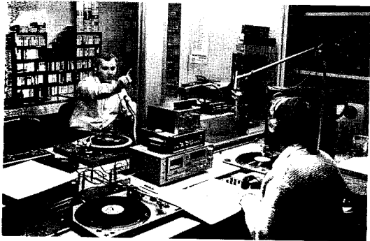
Radio Eisack starsat „live“