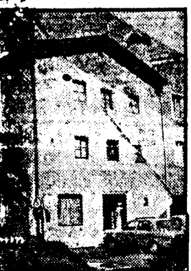
Scheinbar: „Radio-Brenner“-Studio in Sterzing

Die Überleitung für die heute heiße Scheibe lautet: „My little Lady“ — Harry weißblaue Firmennacht und live 102,2 Megahertz mit dem Bayern 3 tief